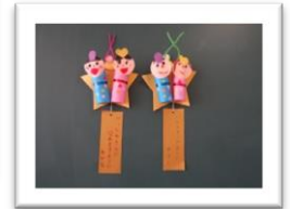
* ゆきぐみ *