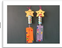
★ ほしぐみ ★