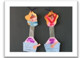
✿ はなぐみ ✿